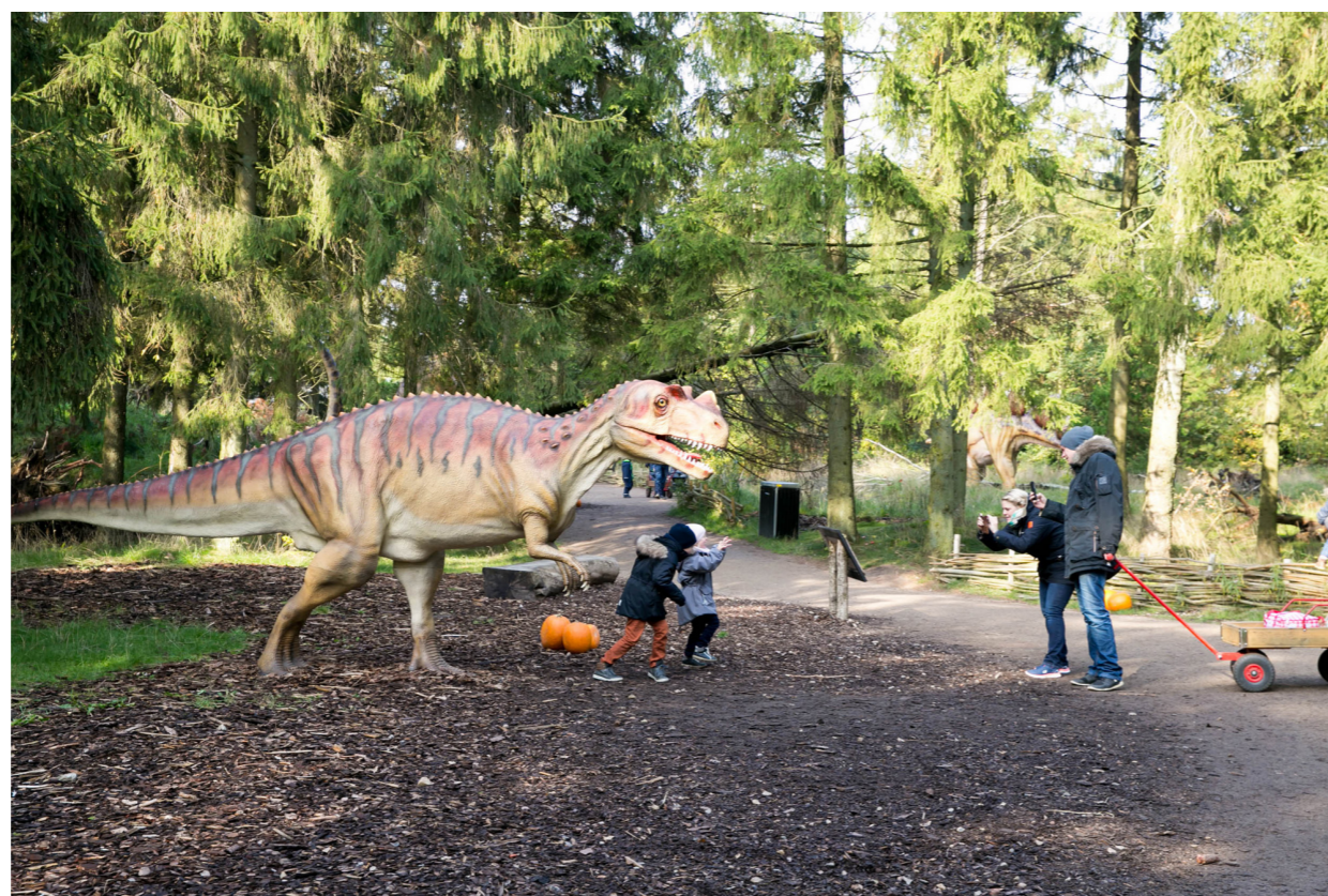
(Dinosaur Park, Givskud, Dánia)