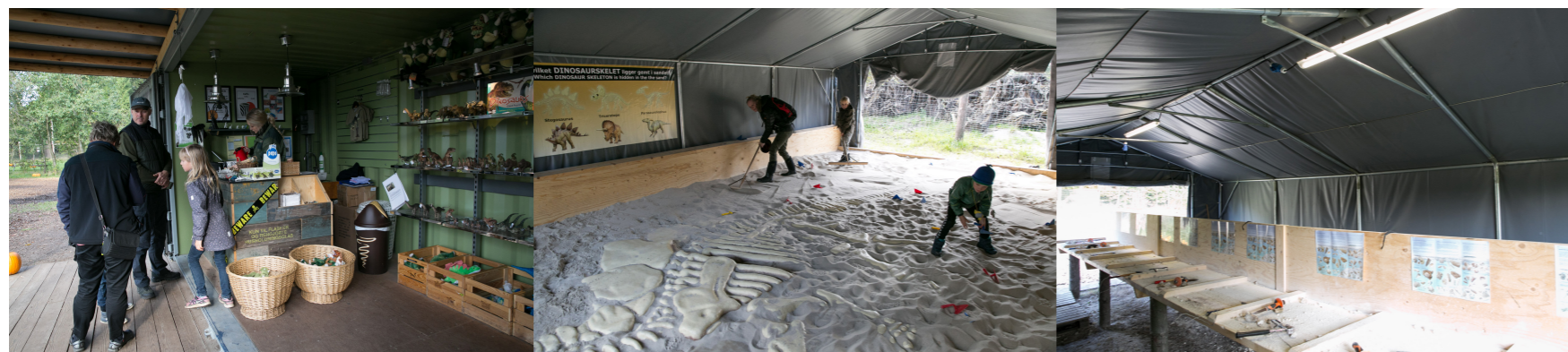
Ajándéktárgyak értékesítése, ásatás, foglalkoztató. (Dinosaur Park, Givskud, Dánia)