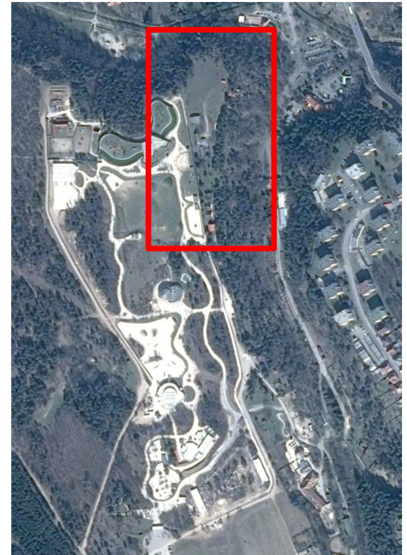
A terület