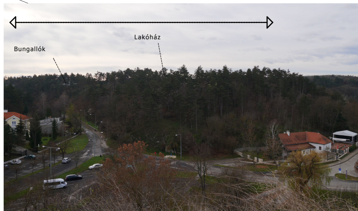
Nézet a Viaduktról. A növényzet megfelelően összefűrészt, takarja a helyszínt.